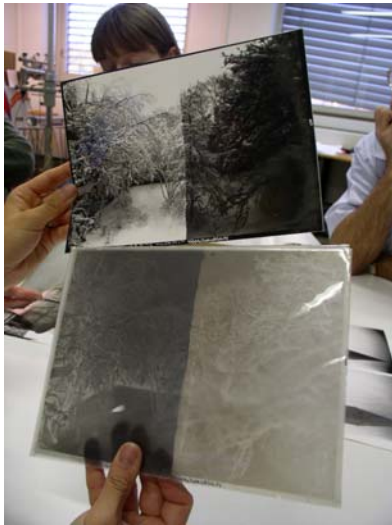
Odstraňování stříbrného zrcátka

etanolovým roztokem s obsahem jódu. Tuto metodu zatím na sbírkových fotografických materiálech neaplikovala.