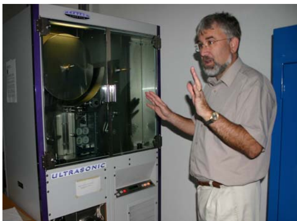
Ultrazvukové čisticí zařízení (Ultrasonic)