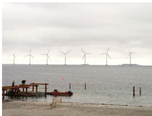
„Les“ větrných elektráren v Kodani

Technické vybavení restaurátorských ateliérů, používané metody a postupy konzervování a restaurování jsou prakticky totožné, jaké používáme v Národním archivu.