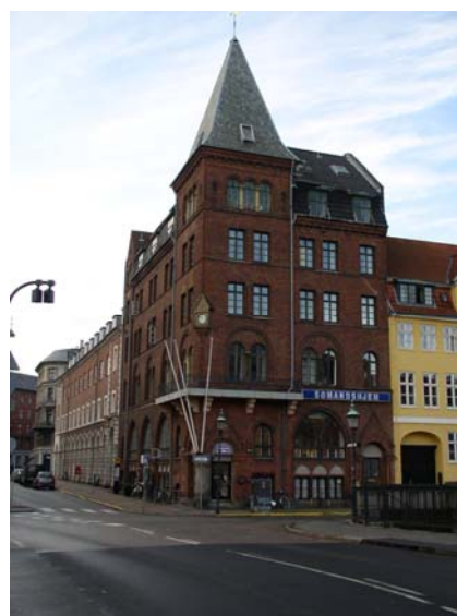
Hotel Bethel Nyhavn