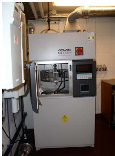
Komora na umělé stárnutí