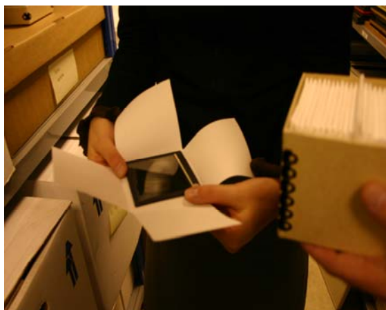
Ukládání skleněných negativů