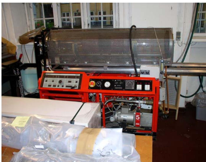
Přístroj pro plasmatickou redukci

Technická vybavenost školy je na vysoké úrovni, školství a kultura jsou v Dánsku státem štědře podporovány, což bylo patrné především na vybavení chemických a analytických laboratoří (elektronový mikroskop, stereomikroskopy s digitální kamerou, komora na umělé stárnutí s regulací teploty, relativní vlhkosti a intenzity osvětlení).