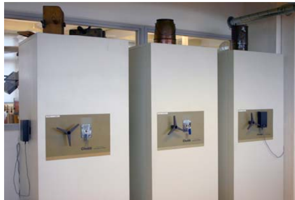
Trezory pro restaurované knihy