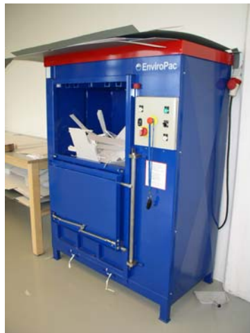
Lis na papírový odpad