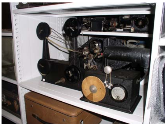
Historický promítací přístroj

Tento institut uchovává nejen kompletní vybavení filmových ateliérů (kamery, světla, stativy ...) a fotografických ateliérů (fotoaparáty, záblesková zařízení, spínací hodiny, zvětšovací přístroje ...), ale především fotografické a kinematografické materiály (alba, promítací filmy, svitkové a ploché negativy, kinofilmy, pozitivy, diapozitivy ...) i magnetické záznamy zvuku (videokazety, magnetofonové pásky ...).