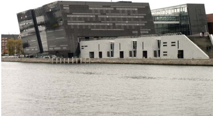
Dánská královská knihovna Black Diamond

Z restaurátorských ateliérů jsme přešli do hlavní budovy Královské knihovny, která je pojmenována podle architektonického ztvárnění Black Diamond . Královská knihovna Black Diamond je umístěna v komplexu historických budov: původní stará budova Královské knihovny, Christiansborg , Dánské židovské muzeum, Divadelní muzeum, Bertel Thorvaldsens Plads a Prins Jørgens Gard .