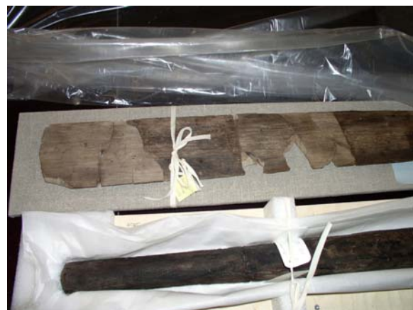
Konzervované zbytky lodí