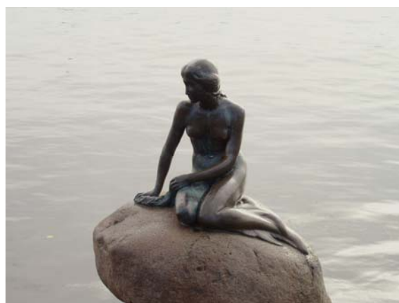
Malá mořská víla