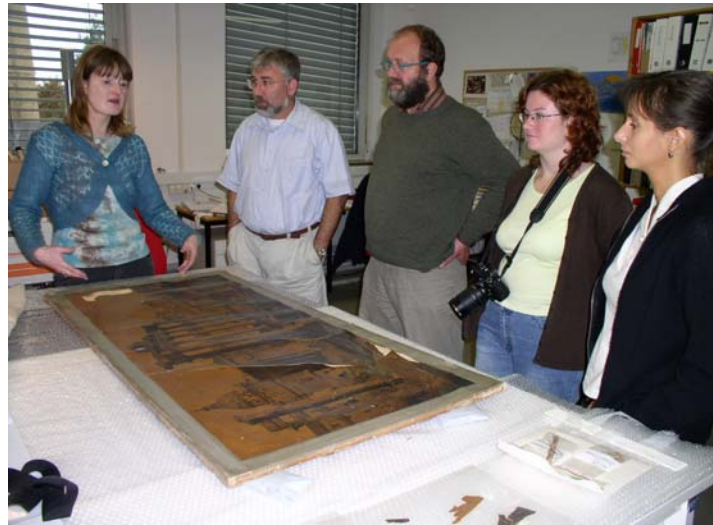
Restaurování ušlechtilého tisku

Ukázala nám také svou rozpracovanou velkoformátovou fotografii, která byla velmi poškozená a křehká. Pravděpodobně se jednalo o druh ušlechtilého tisku.