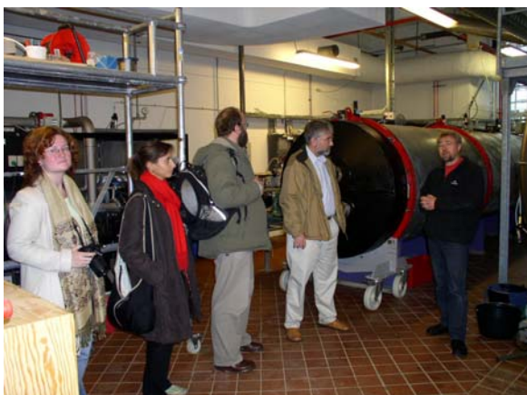
Komory pro impregnaci PEG

Z restaurátorských ateliérů jsme přešli do specializovaného pracoviště na restaurování dřeva, nalezeného v moři při archeologických průzkumech. Toto pracoviště je v celosvětovém měřítku na vrcholu v technologii uchování dřevěných předmětů vyzdvižených z moře. Ještě před vstupem do budovy jsme byli upozorněni, že je všude silný specifický zápach. Nalezené podmořské dřevěné artefakty jsou do poslední chvíle udržovány stále mokré. Ve speciálním zařízení je pak voda nahrazena polyetylenglykolem (PEG), který udrží dřevo v původním tvaru a celé ho zpevní. Měli jsme možnost vidět části lodí, které byly pod vodou několik set let a po konzervaci byly ve velmi dobrém stavu.