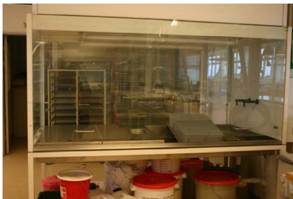
Digestoř přístupná ze tří stran

Zaujali nás drobné rozdíly v řešení technického vybavení například: digestoř s nerezovou vanou přístupná ze tří stran, digestoř s nakloněnou krycí deskou, trezory na restaurované knihy, které jsou odolné proti požáru a jsou vodotěsné. Restaurátorům velmi šetří čas vyřezávací ploter na výrobu ochranných krabic pro restaurované knihy, lis na zbytky papíru a kartonů je pro Dány také samozřejmostí.