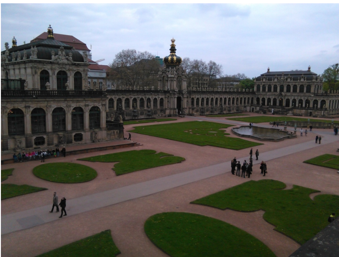
obr. 5 - Drážďany