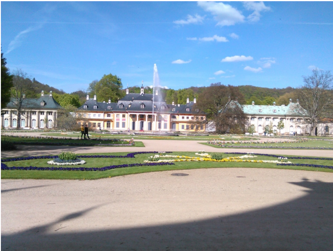
obr. 4 – zámek Pillnitz