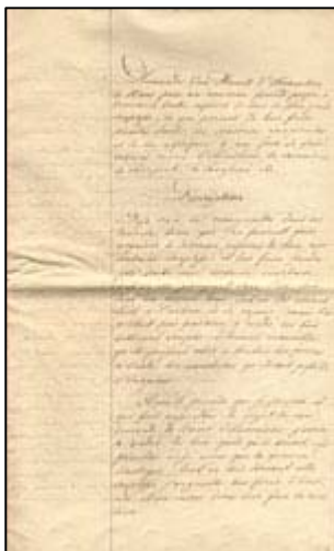
Popis výroby ohýbaného nábytku vlastní metodou M. Thoneta (1. strana) (NA, RAM-AC 10/757)