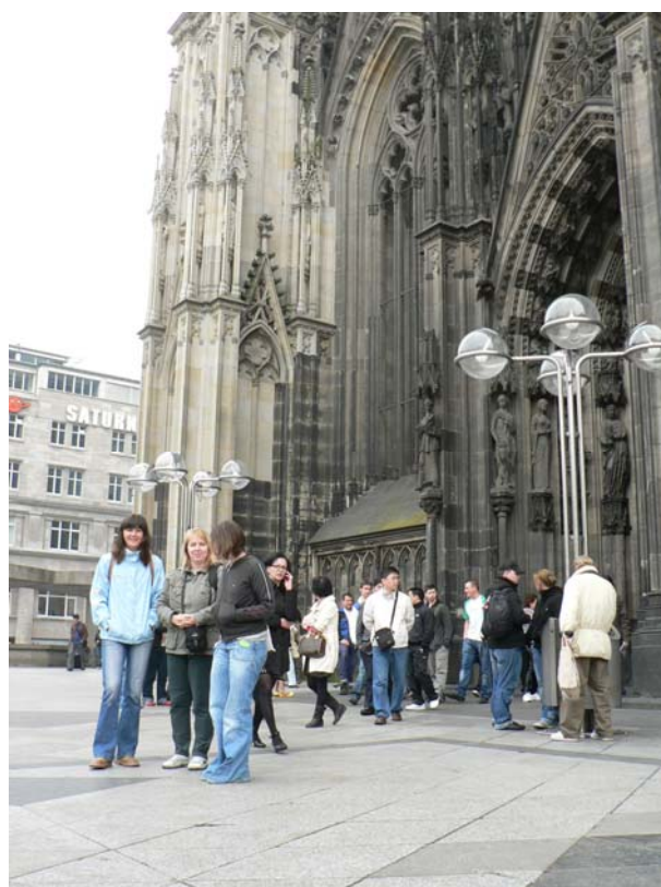
Před kolínským Dómem

V neděli dopoledne před odjezdem jsme již měli volno, které jsme využili k prohlídce historického centra Kolína nad Rýnem. Ve 13:30 přijela další skupina dobrovolníků z Prahy, která nás střídala. Seznámili jsme kolegyně a kolegy s ubytovacími prostorami a přibližně ve 14: 00 vyrazili zpět do Prahy, do Prahy jsme přijeli v pozdních večerních hodinách