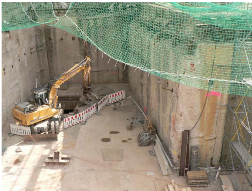
Již vyklizené prostory metra

(v těchto místech byla zasypána větší část archivu a sousední budovy)