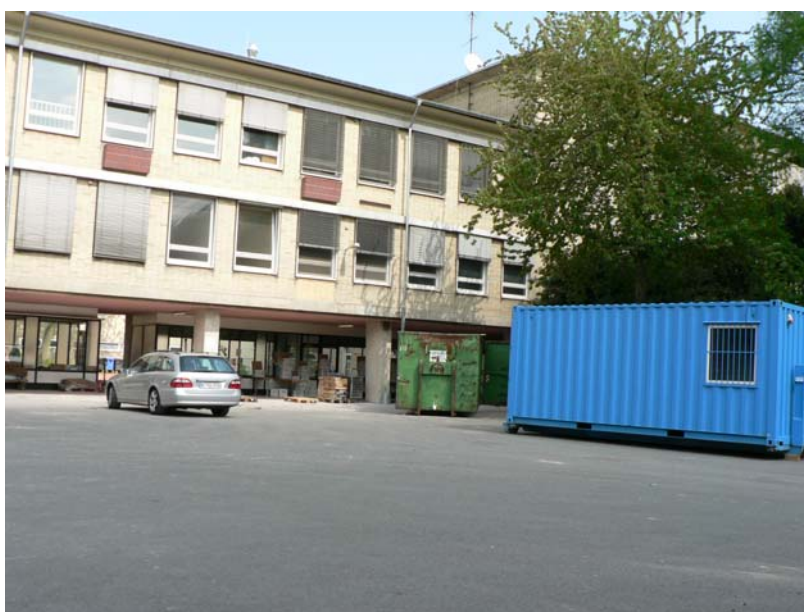
Budova školy, ve které byly poškozené archiválie čištěny a baleny.

Pracovní oděv, tj. papírové ochranné obleky na jedno použití, pevné pracovní body s okovanou špičkou, rukavice a respirátory byly na místě k dispozici v dostatečném počtu, kvůli zvýšeným bezpečnostním opatřením bylo nařízeno pracovat v ochranných přilbách a byli jsme proškoleni o bezpečnosti práce.