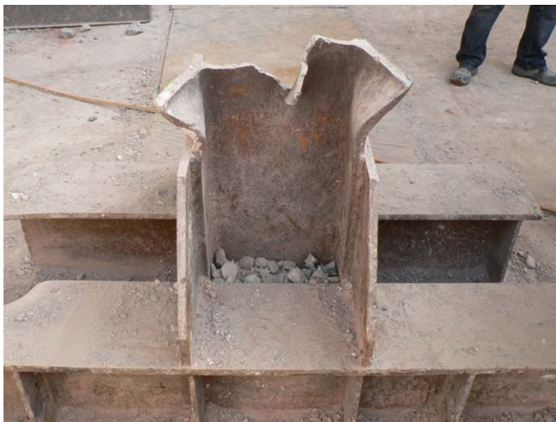
Poškozený kovový nosník dokumentuje, jak velký tlak byl při sesuvu budov

V neděli dopoledne před odjezdem jsme již měli volno, které jsme využili k prohlídce historického centra Kolína nad Rýnem. Ve 13:30 přijela další skupina dobrovolníků z Prahy, která nás střídala. Seznámili jsme kolegyně a kolegy s ubytovacími prostorami a přibližně ve 14: 00 vyrazili zpět do Prahy, do Prahy jsme přijeli v pozdních večerních hodinách