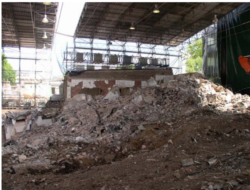
Místo katastrofy – zbytky budovy archivu chráněné provizorní střechou