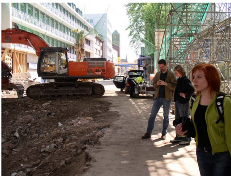
Místo katastrofy – prostor ulice před archivem.