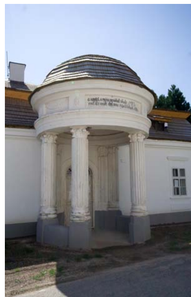
Muzeum v Blatnici