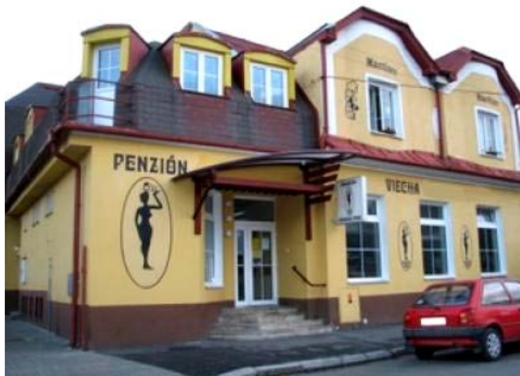
Penzion Čierna pani, Martin - Slovensko

Po dlouhé a vyčerpávající 7 hodinové cestě vlakem jsme se ubytovaly v penzionu Čierna pani v Kuzmányho ulici v Martině.