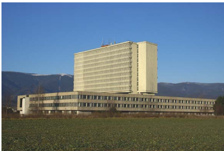
Hlavní budova Slovenské národní knihnice v Martině