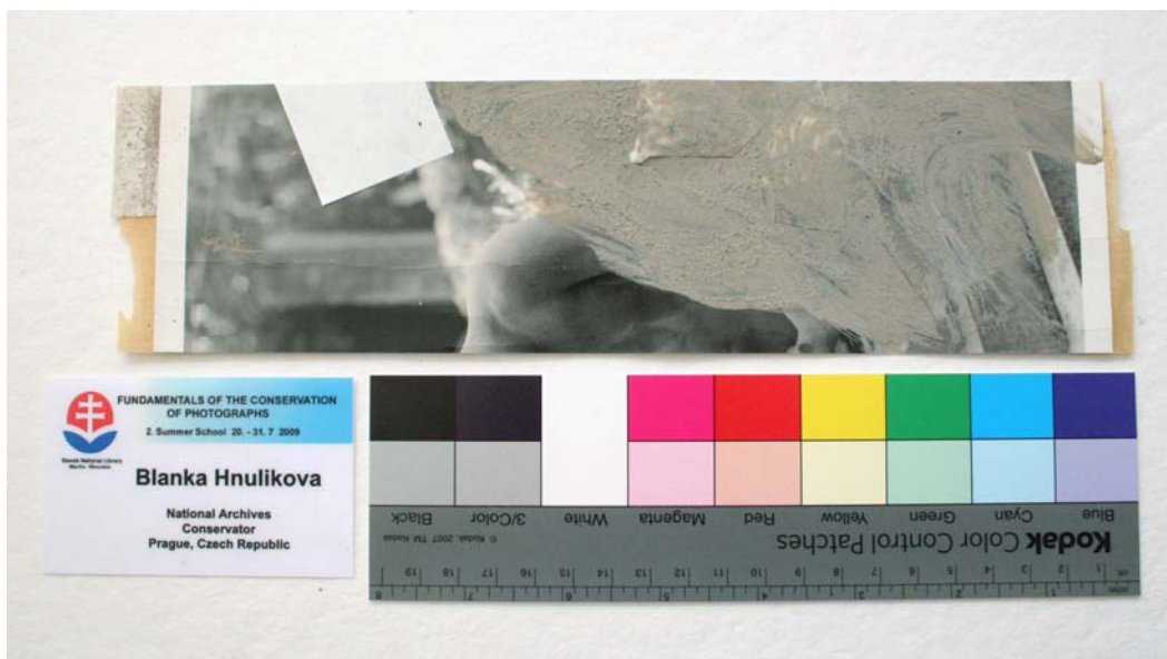
Ukázka znečištění modelového vzorku