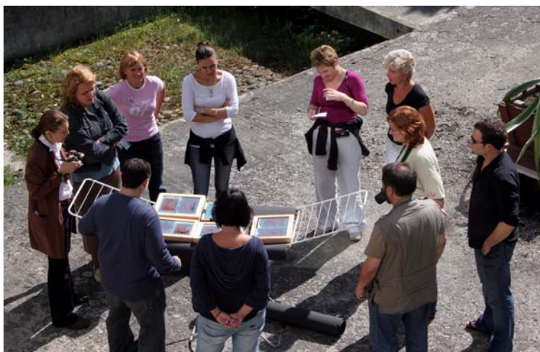
Exponování kyanotypií na slunci

do kopírovacího rámečku a pak exponován na slunci, po dostatečné expozici (při změně barvy do zelena) byl papír vyprán ve vodě. Ustalování a praní se provádělo v jednom kroku.