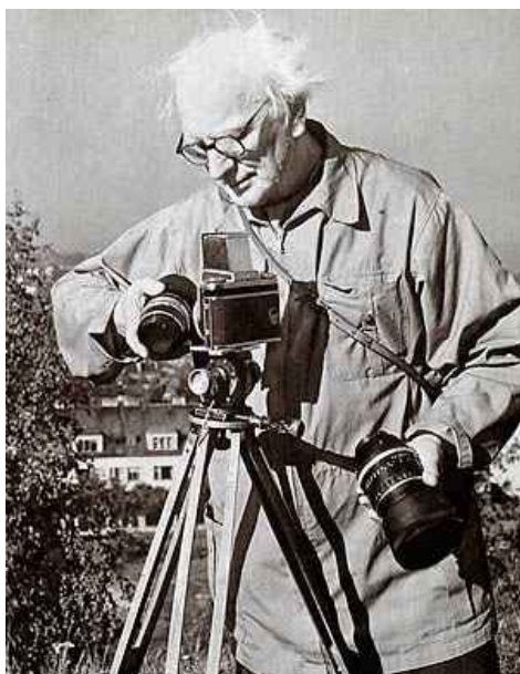
Fotograf Karel Plicka

V sobotu jsme jeli do Blatnice, kde je muzeum českého a slovenského fotografa, filmaře, režiséra, etnografa, hudebníka a pedagoga Karla Plicky.