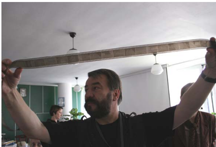
Demonstrace filmu vyvolaného kávou